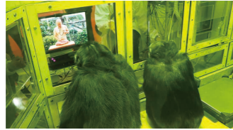
アイトラッキングによる実験の様子

チンパンジーのために制作した映像作品による実験の様子を紹介し、研究者による発表とディスカッションからチンパンジーの気持ちに迫ります。