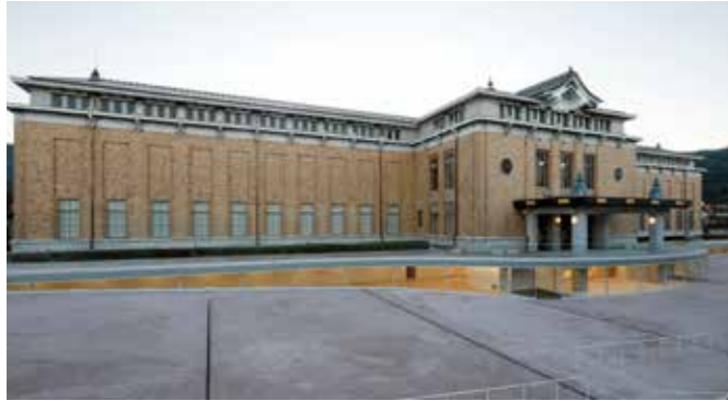
京都市京セラ美術館外観

KYOTO STEAM –世界文化交流祭–実行委員会が主催する、第2回目のフェスティバル「KYOTO STEAM –世界文化交流祭–2022」のコアプログラムとして、2021年度に「KYOTO STEAM 2022 国際アートコンペティション」を開催します。