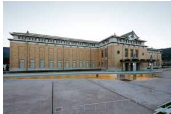
京都市京セラ美術館外観

KYOTO STEAM –世界文化交流祭–実行委員会が主催する、第2回目のフェスティバル「KYOTO STEAM –世界文化交流祭– 2022」のサブプログラムとして、2021年度に「KYOTO STEAM 2022 国際アートコンペティション」を開催します。本コンペティションは、アーティストと企業・研究機関等（以下「企業等」という。）がコラボレーションすることで制作した作品を展覧し、表彰する、日本で類を見ない形式の国際コンペティションです。アーティストと企業等の双方を広く募り、両者の創造力を融合させることで、「アート×サイエンス・テクノロジー」の可能性を体現する作品を制作し、その作品の中から優秀な作品を表彰します。つきましては、本コンペティションに参加し、企業等とコラボレーション制作を行うことを望むアーティストから、作品プランを募集します。コラボレーションの中で自らの創造力と企業等の創造力をしなやかに結びつけ、企業等の持つ素材や技術、データ、知見等に新たな価値を見出し、コラボレーションでしか生み出すことのできない作品を創り出すこと。領域横断的な実践によって創作される、新たな芸術作品を世界に向け発表することに意欲的なアーティストの参加を広く募ります。