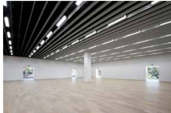
京都市京セラ美術館 新館 東山キューブ